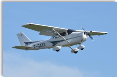
F-GAXZ CESSNA 172 (Balade – voyage) Nombre de places : 3 ou 4