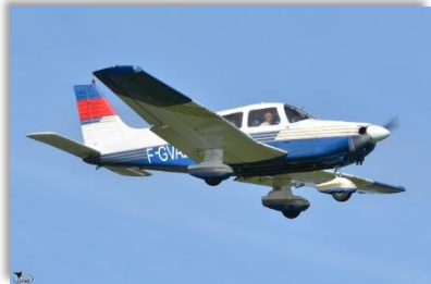
F-GVAZ PIPER PA28 Archer II (Balade – voyage) Nombre de places : 3 ou 4