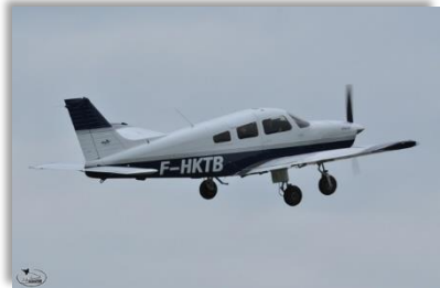
F-HKTB PIPER PA28 Archer III (Balade – voyage) Nombre de places : 3 ou 4