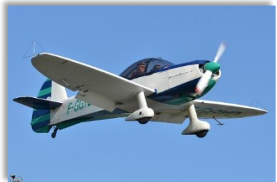
F-GGYD MUDRY CAP 10 (voltige) Nombre de places : 2