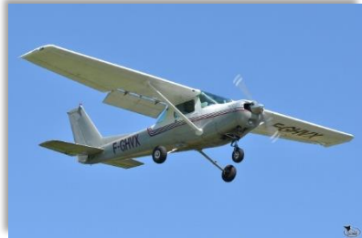
F-GHVX CESSNA 152 II (école) Nombre de places : 2