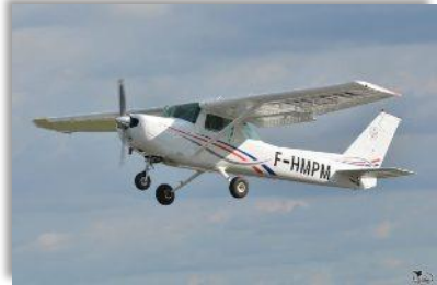
F-HMPM CESSNA 152 II (école) Nombre de places : 2