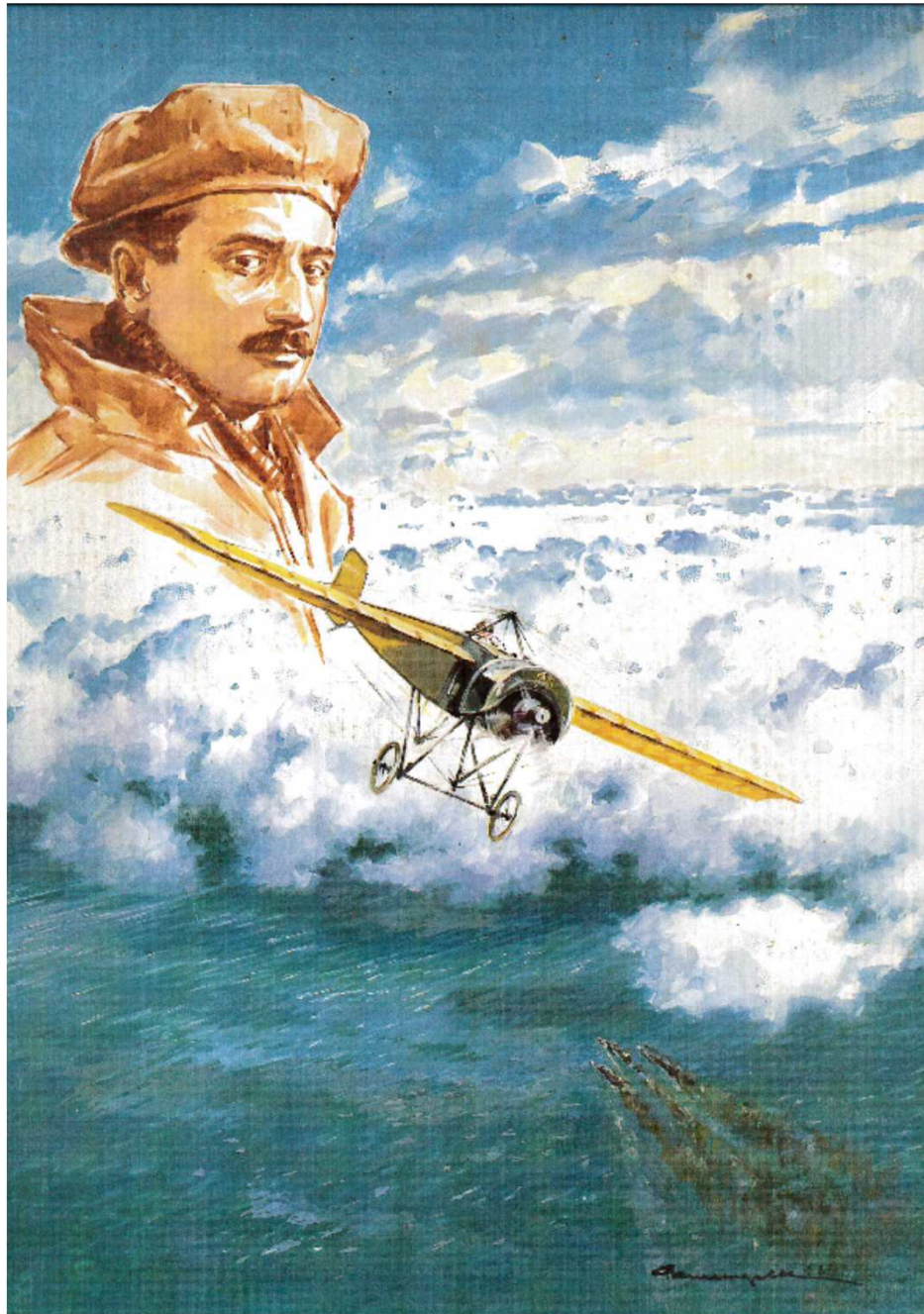
1888-1988 : Célébration du centenaire de la naissance de Roland GARROS 1